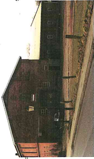
Ortsbildprägende Hofstelle im zentralen Ortsbereich - Dorfstraße 8