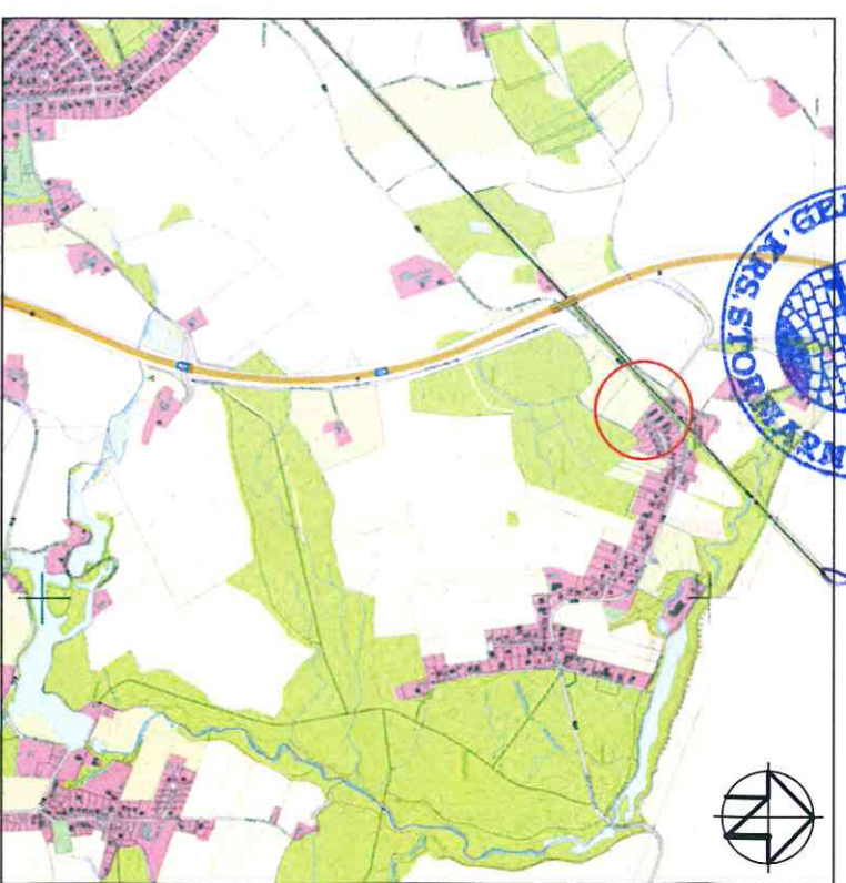
Übersichtspl. M. 1 : 25.000